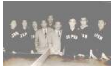
【世界卓球選手権大会の日本選手団】

ドイツに派遣された翌年、1959年3月27日～4月5日までドルトムントの、ウェストファーレンホール（Westfalahalle）で第25回世界卓球選手権大会があった。私たちは連日、日本選手団の応援に出かけた。日本、韓国、中国のペンホールダーとヨーロッパのシェークハンドの戦いだったが、当時はペンホールダーが優勢だった。男子個人が中国の容国团選手だったが、日本は7種目中6種目の優勝でした。男子は、荻村、星野、村上、成田、女子は松崎、江口、難波、山泉の各選手の大活躍で、特に団体戦の準決勝の荻村選手とハンガリーのシド選手の試合は今でも目に浮かびます。大柄のシド選手に、体格だけで見ると大人と子供の試合みたいだった。選手たちは私たちが握ったおにぎりを食べ、元気が出たと喜んでくれた。私が下宿し始めたのも卓球が縁でした。