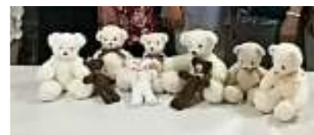
【クマさん勢ぞろい】

「ドイツニュースを聞く会」(“Deutschkurse – Nachrichtenzirkel”)と「ドイツ映画を見る会」(“Deutschkurse – Filmzirkel”)は今年2月から始めた新鮮なサークルです。会員同士で、「誰が先生で誰が生徒」という関係ではなく、ワイワイガヤガヤ楽しみながらドイツ語の勉強、そしてニュースの背後にある諸事情を勉強しようという趣向です。1月・2月は「ニュース」で3月が「映画」、また4月・5月「ニュース」で6月が「映画」というサイクルで進めています。