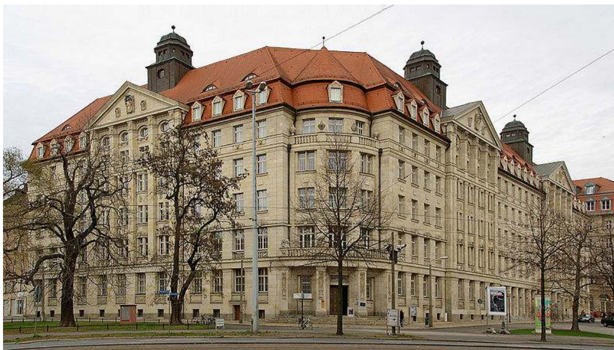
【ライプツィヒにある Runde Ecke - 1950~1989 ” Stasi “ シュタージ の県本部】