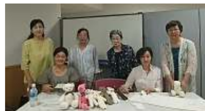
【ある日の活動メンバー】

「クマさん作りの会」は2017年の「第7回ドイツフェスティバル in ぐんま」を機に形成されました。フェスティバル終了後も2年後のフェスティバルに備えて毎月最終木曜日に定期的に活動しています。いろいろな生地で、いろいろな形・色・大きさのクマさん作りにおしゃべりも楽しみながら挑戦をしています。出来上がったクマさん、一つ一つ表情も違ってとてもかわいいんです。その多くがドイツの友人へのお土産、施設の高齢者、孫たちへのプレゼンなどと手元から離れてそれぞれの場で活躍しています。テディベアの母国、ドイツへのお土産にも大変喜ばれている、なんてなんだか奇妙ですね。