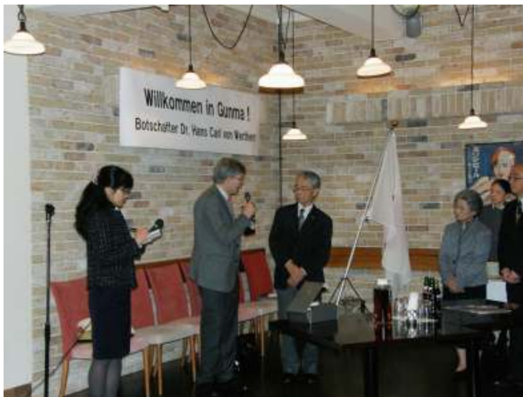
【2017年11月28日 ヴェアテルン大使とのレセプションにて】